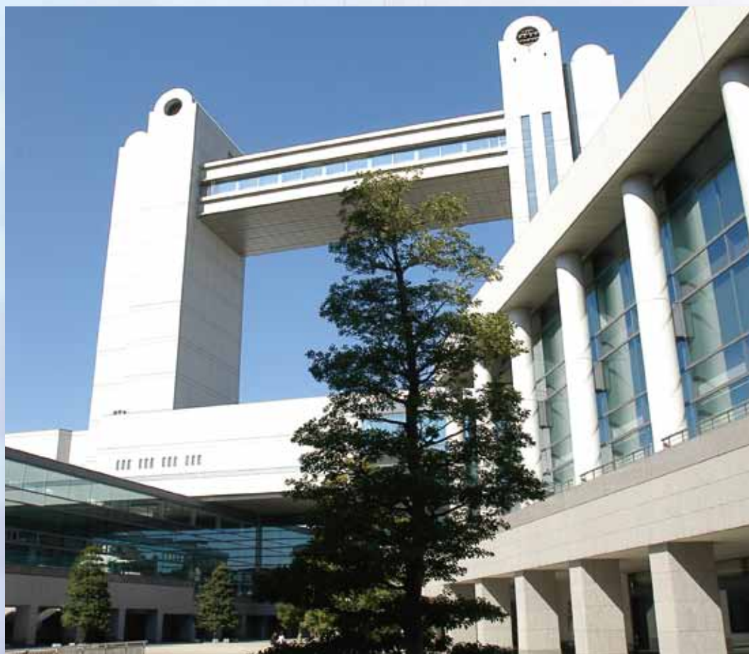
名古屋国際会議場(名古屋市)