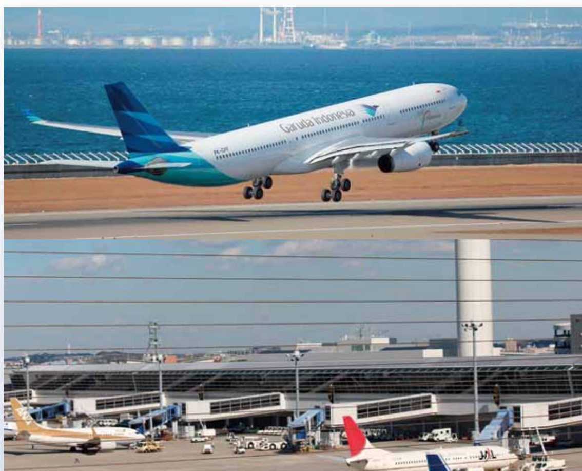
中部国際空港 セントレア(常滑市)